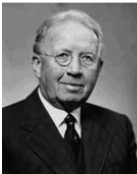
Dr. Harry Emerson Fosdick